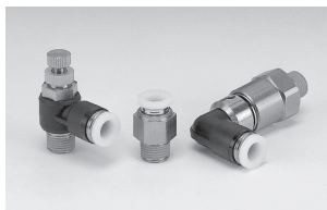
開放リング色：ホワイト