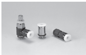
ミニタイプ開放リング色：ホワイト